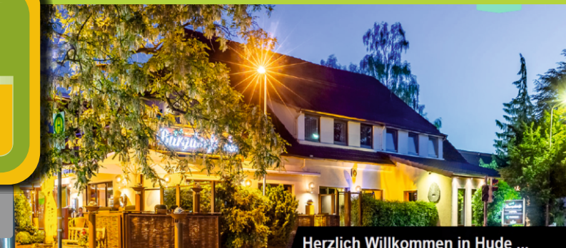
Herzlich Willkommen in Hude ...