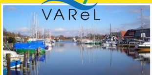
Aal & Krabbe Fischrestaurant