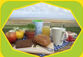
Der Dödel v. Dangast