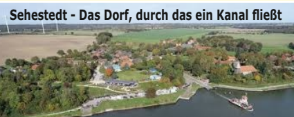
Sehestedt - Das Dorf, durch das ein Kanal fließt