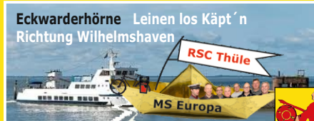
Eckwarderhörne Leinen los Käpt'n Richtung Wilhelmshaven