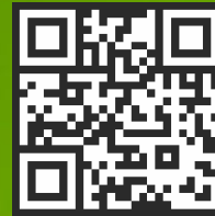
QR-Code HP RSC