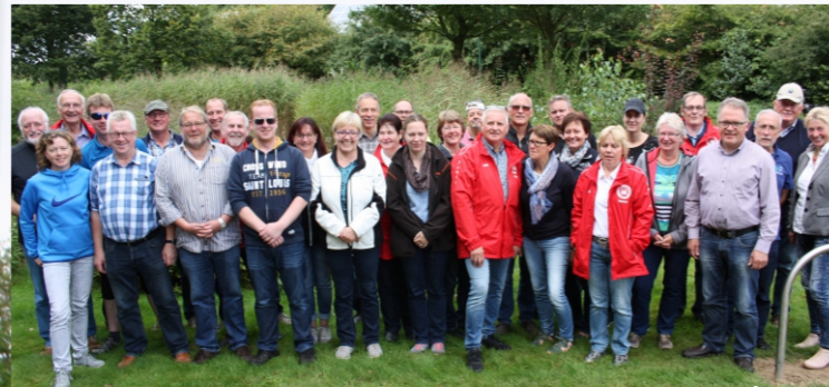
Rückblick Tour Haselünne 2017