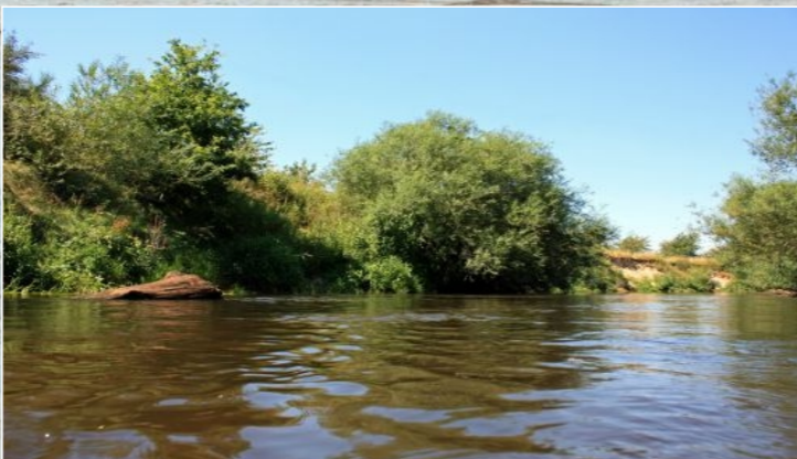
Entlang der Hunte